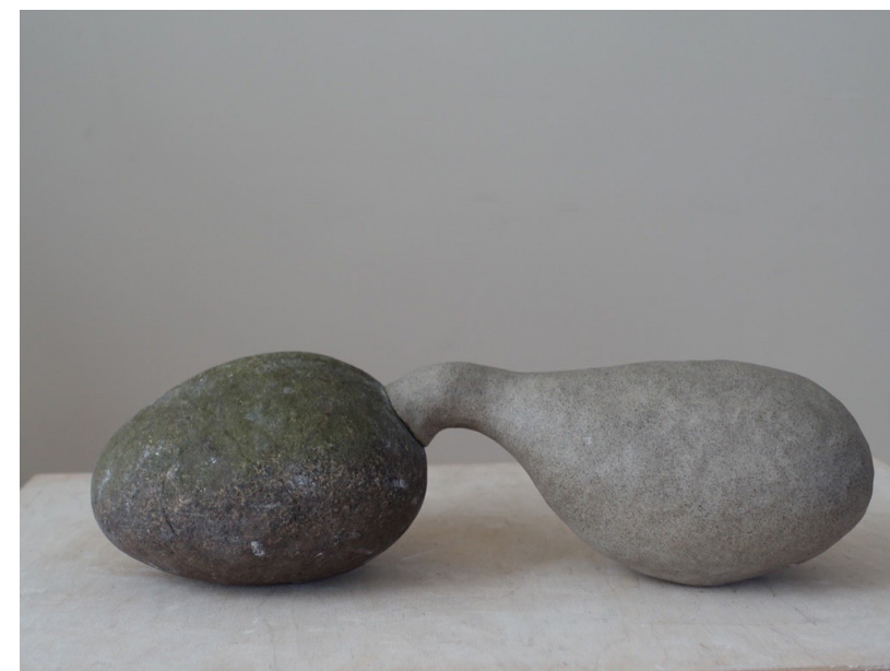
Smaken av sten, skulptur av Annika Svenbro